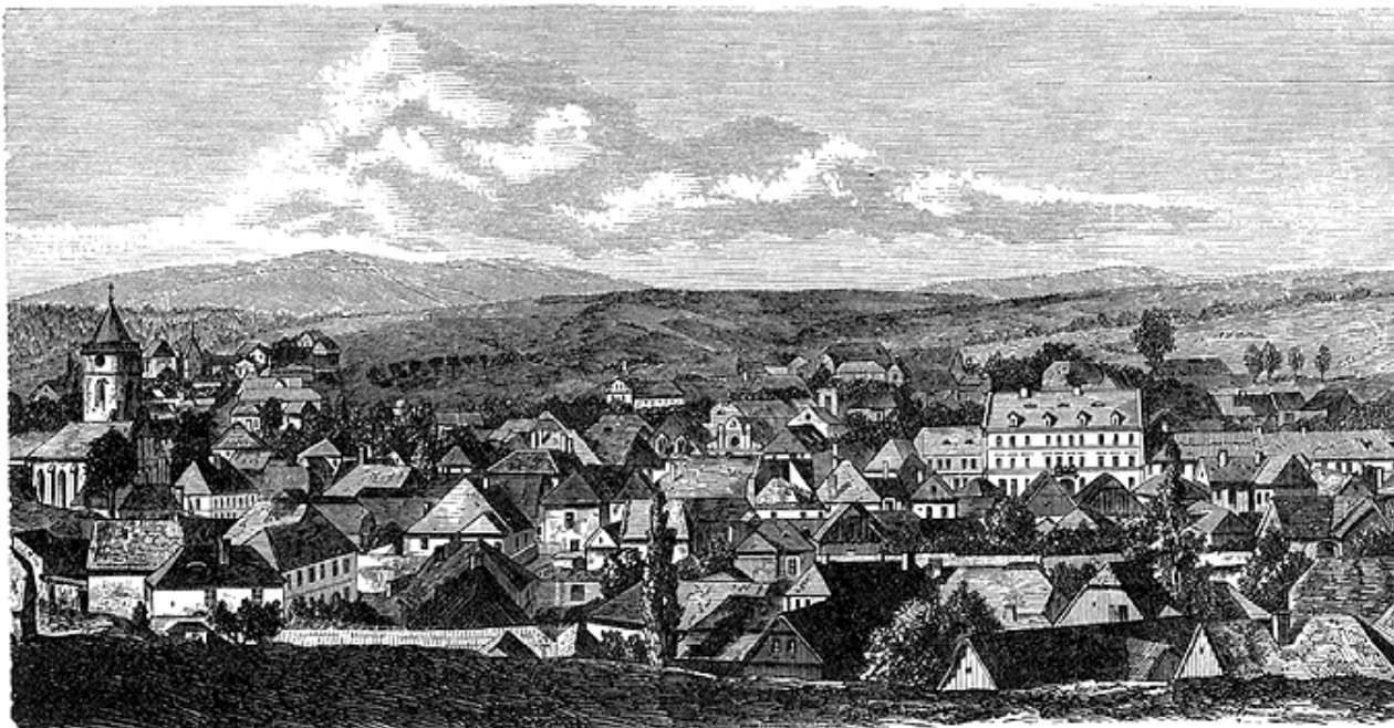
Město Ledec od strany severní.

místopísaři, úředníkům desk dvorských. Výprosníci tito nemohouce nebo nechtíce nároků svých na vrch práva dovésti, vzdali se dědictví odpírajícímu Janovi Hadburkovi z Sobučic (r. 1458), načež tento od úředníků dvorských na Lacembok zaveden jest. 4) Ke sklonku téhož roku prodal Jindřich Hadburk z Sobučic “dědiny své manské” k Vyšehradu, hrad Lacembok pustý, jinak Zíkev, ves řečenou Seboboř celou pustou s rolemi, lukami, lesy, potoky a věno Alžbětino Jindřichovi z Říčana a z Ledče za 108 kop grošů českých, pročež hrad pustý na vždy k panství Ledeckému připojen byl. 5) Ve vkladech desk zemských, r. 1544 a 1550 Markétou Ledeckou z Říčana učiněných, poselndě se připomíná jako Lacembok a Lancembok hrad pustý. 6)